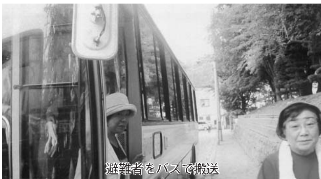
避難者をバスで搬送

一方、役場駐車場では、交通事故により車内に閉じ込められた負傷者の救助も行われ、救急隊員や機動隊員の救出から病院への搬送まで緊迫したやり取りが、実践さながらに繰り広げられました。