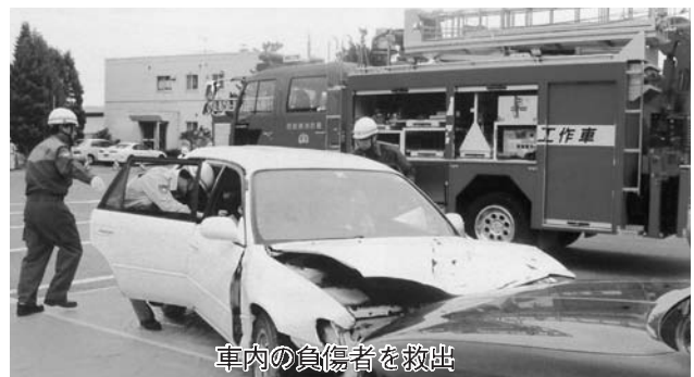
車内の負傷者を救出