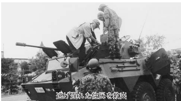
逃げ遅れた住民を救出

参加者らは、訓練終了後炊き出し訓練で作ったカレーライスを食しながら、噴火当時に思いを馳せていました。