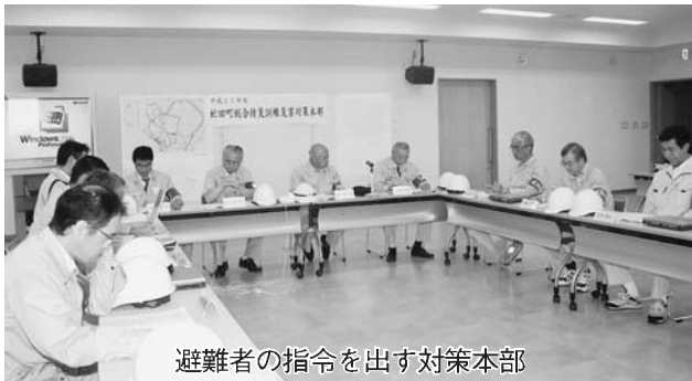
避難者の指令を出す対策本部

今回の訓練は、役場の防災研修ホール機能を初めて使用し、まず災害対策本部での災害対