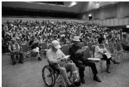
自衛隊音楽隊の演奏に聴き入る観客

演奏会では、吹奏楽オリジナル作品やテレビでお馴染みのAKBメドレー、時代劇メドレーなどが演奏され、会場に訪れた多くの聴衆を魅了しました。