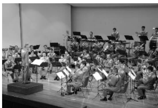
演奏会で観客を魅了した自衛隊音楽隊