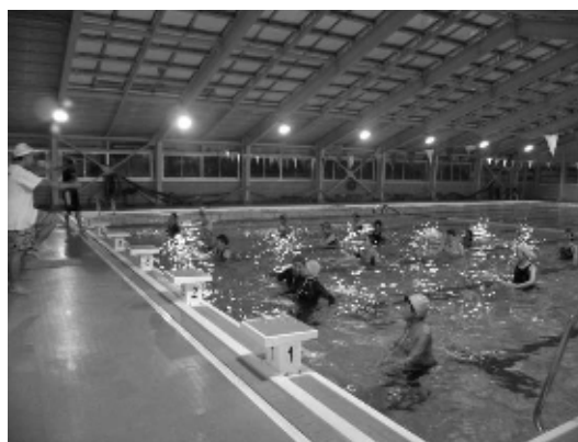
水中での全身運動で健康づくり

教室では、スポーツ推進員が中心となり、プールサイドで準備体操を行った後、プール内で体を伸ばしたり、跳ねたりしながらウォーキングアップ。体を水に慣らした後に行われた水中エクササイズでは、音楽に合わせて水中でダンスをするなどし、最後に呼吸を整え、プログラムを終了させました。水の抵抗による動きにくさのなか、水中での全身運動に参加者らは楽しみながら、健康づくりに励みました。