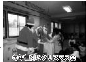
毎年恒例のクリスマス会