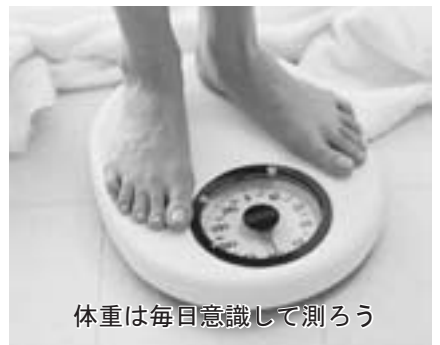
体重は毎日意識して測ろう

鮮でおいしい野菜がすぐに手に 入ります。地元のおいしい野菜 を健康づくりのためにも大いに 活用しましょう！