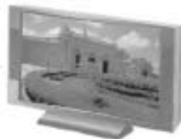
地上デジタル放送対応 テレビ