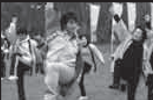
NHKBS「ドゥ！エアロビック」の公開録画で元気に踊る参加者