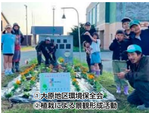
① 大原地区環境保全会 ② 植栽による景観形成活動