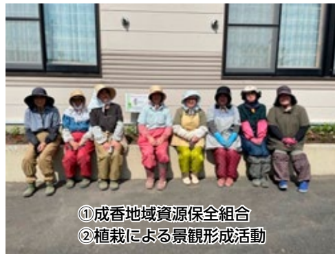
① 成香地域資源保全組合 ② 植栽による景観形成活動