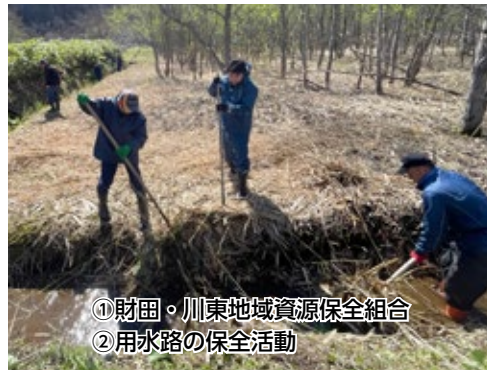
① 財団・川東地域資源保全組合 ② 用水路の保全活動