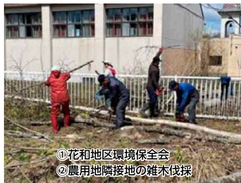
① 花和地区環境保全会 ② 農用地隣接地の雑木伐採

私たちは、農地・農道等の 地域資源の保全活動や機能向上のための 共同活動に取り組んでいます