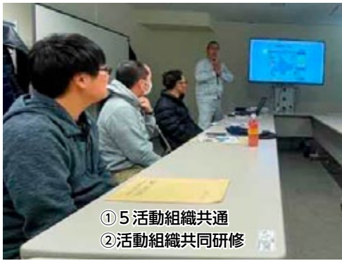
① 5 活動組織共通 ② 活動組織共同研修