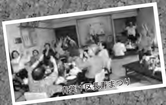
青葉1区長寿まつり