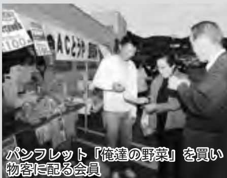
パンフレット「俺達の野菜」を買い物客に配る会員

パンフレットは、A4版の3つ折りで、四季を通じた旬の野菜をイラストで表し、おいしい食べ方のレシピも紹介しています。