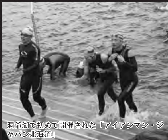
洞爺湖で初めて開催された「アイアンマン・ジャパン北海道」