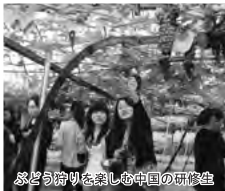
ぶどう狩りを楽しむ中国の研修生

参加者の一人は、「日頃仕事が忙しく、なかなか遊びに出る機会が少ないので、今日は本当に楽しい」と天候に恵