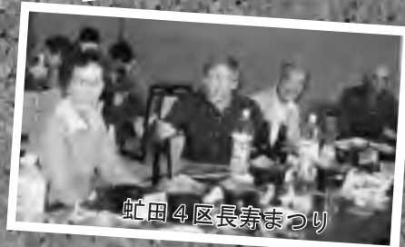
蛇田4区長寿まつり