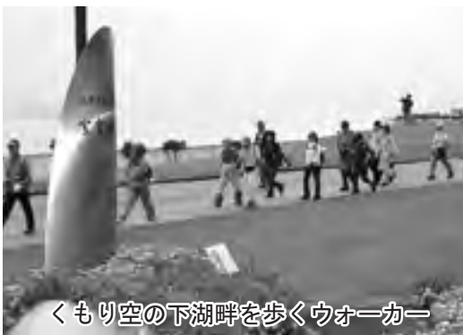
くもり空の下湖畔を歩くウォーカー