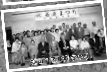
蛇田1区長寿まつり