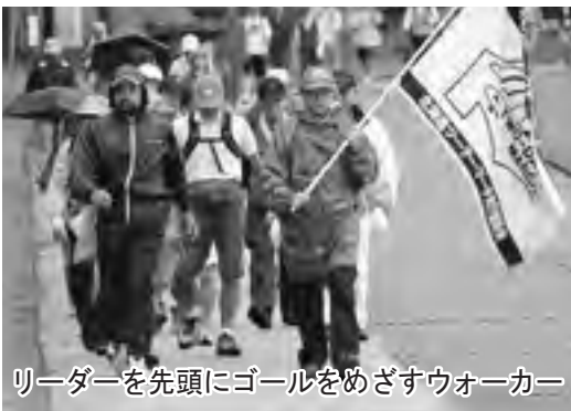
リーダーを先頭にゴールをめざすウォーカー

2日目は、「伊達・有珠山ぐるっとジオコース」（30キロ）を含め4コースが、雨の中で実施。途中から土砂降りとなり、ウォーカーは濡れになりながら、完歩を目標に歩き続けました。会場では、ロータリークラブの会員の皆さんが、オニオンスープなどを振る舞い、歩き疲れたウォーカーを和ませました。