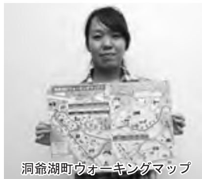
洞爺湖町ウォーキングマップ