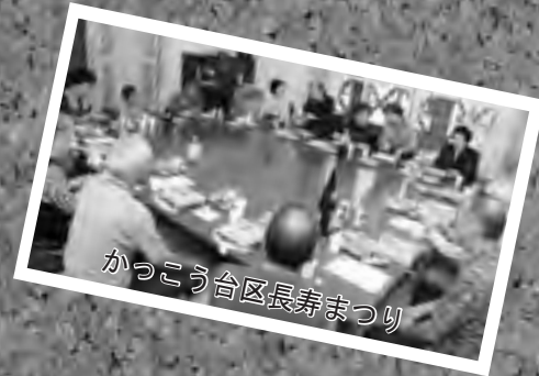
かつこう台区長寿まつり