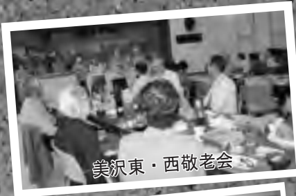
美沢東・西敬老会