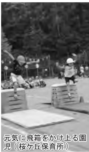
元気に飛箱をかける園児（桜ヶ丘保育所）