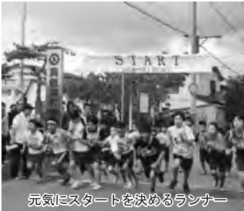
元気にスタートを決めるランナー

第18回洞 爺湖町 クォーター マラソン駅 伝大会 （洞 爺湖町陸上 競技協会主 催）が、9 月23日あぶ たふれ合い