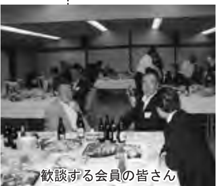
歓談する会員の皆さん

札幌市近郊に在住している洞爺湖町出身者で結成された札幌とうや湖会の第60回の総会が、9月21日町内のホテルで開催されました。会員らは、旧交を温め合い、楽しい一時を過ごしました。