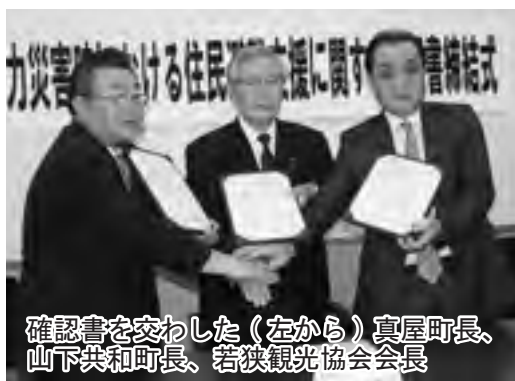
確認書を交わした（左から）真屋町長、山下共和町長、若狭観光協会会長

に隣接する共和町と、9月6日、洞爺湖町役場で「原子力災害時における住民避難支援に関する確認書」を交わしました。