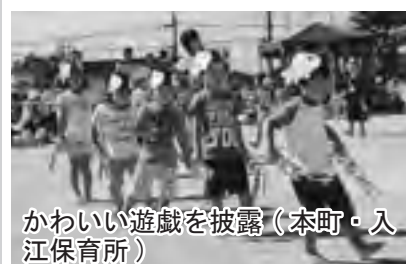
かわいい遊戯を披露（本町・入江保育所）