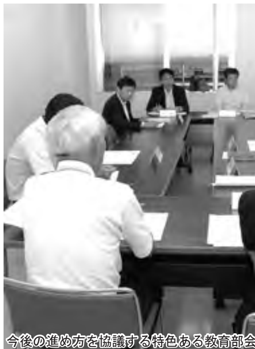
今後の進め方を協議する特色ある教育部会

ハードスケジュールの中で集中審議し、提言・報告、あるいは資料をまとめることとなりますが、洞爺湖町全体の教育環境を整えることにより、洞爺湖町の子ども一人ひとりのための「確かな学力を保障する学校」「子どもたちが笑顔で楽しく通える学校」「洞爺湖町の将来を担う子どもたちを育成する学校」の創造のために、皆様の熱い思いを込めたお力をお貸しいただきたくお願い申し上げます。