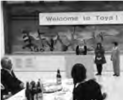
二人を迎えて行われた歓迎会

祝賀会では、日本語の理解がまだ十分でない二人ですが、各会員とも交流し、笑顔を見せていました。