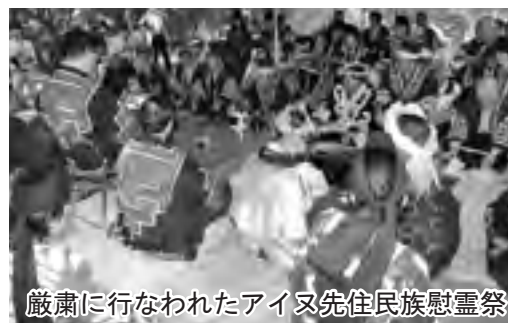
厳粛に行なわれたアイヌ先住民族慰霊祭