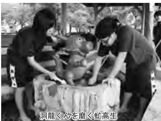
洞龍くんを磨く虻高生

当日は、あいにくの雨で、少し肌寒い天候でしたが、3班に分かれ、「洞龍の足湯」「足湯ポケットパーク」「長寿と幸せの手湯」の3カ所を清掃。お湯を抜いた足湯をデッキブラシでこすり上げ、湯あかを落とすきれいにしました。