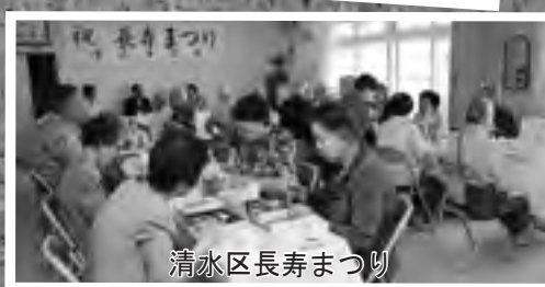
清水区長寿まつり

9月16日の敬老の日にちなみ、洞爺湖町では、今年度100歳の百寿と88歳の米寿を迎えた皆さんに、祝い金などを贈り、長寿をお祝いました。 対象となったのは、百寿は8人で、米寿は