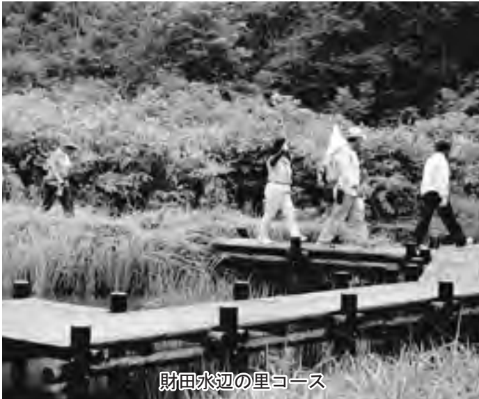
財田水辺の里コース

認定の基準は、①総距離が1、34 キ または3000歩以上②案内標識が設置されている③自然性に恵まれた環境④休憩施設やトイレが設置されている