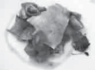
皆さんが収穫した佐伯農園ミニトマトと月浦ワインのソース