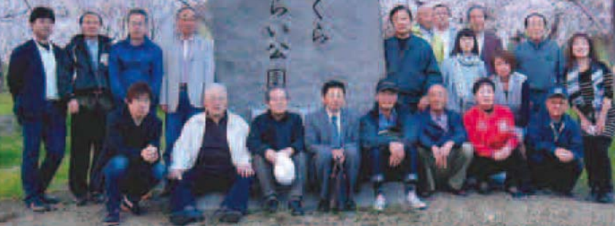
2015年春 満開の桜とメンバー達

さくら・みらい公園は、1994年荒地造成から、2000年旧虻田町へ贈呈まで、会員の労力奉仕で完成しました。