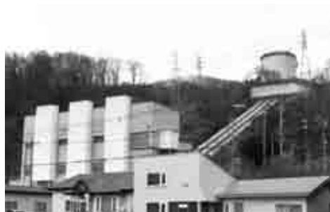
虻田発電所。海と湖の高低差(84m)を利用し、昭和14年から水力発電が行われています。

洞爺湖に集まった水は、サクラマスやヒメマス、コイ、ワカサギ、フナ等の生き物を育み、また飲料水としても利用されています。さらに、噴火湾に近く、海と湖の高低差があることから水力発電にも利用されています。