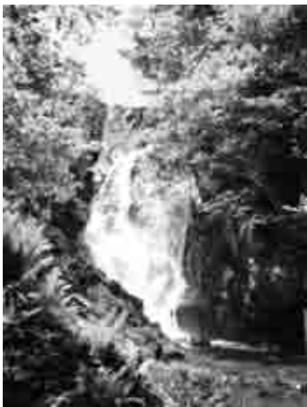
自然の流出口、壮瞥滝。 滝の近くまで歩いて行けます。