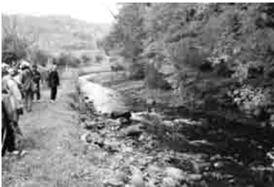
秋のソウベツ川。サクラマスが遡上します。