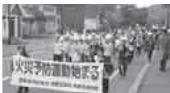
とうや地区で行なわれた防火パレード

鼓笛隊を先頭に、約1kmパレードし、「火の用心」を地域の人たちに呼びかけました。