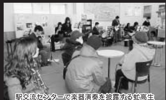
駅交流センターで楽器演奏を披露する虹高生